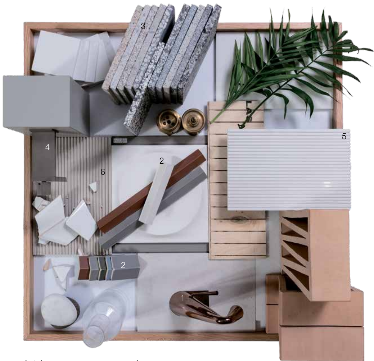
1. ברז בנימור נחושת מבית המותג האיטלקי Gessi 2. אריחי תלת מימד. עיצוב האחים BOUROLLEC מבית המותג האיטלקי MUTINA 3. אריחי טראצו על בסיס צמנט 4. ברז מבית המותג האיטלקי cea נוף נירוטטה 316 5. אריח אבן קררה מחורץ 6. אריח אבן אומברה מחורץ