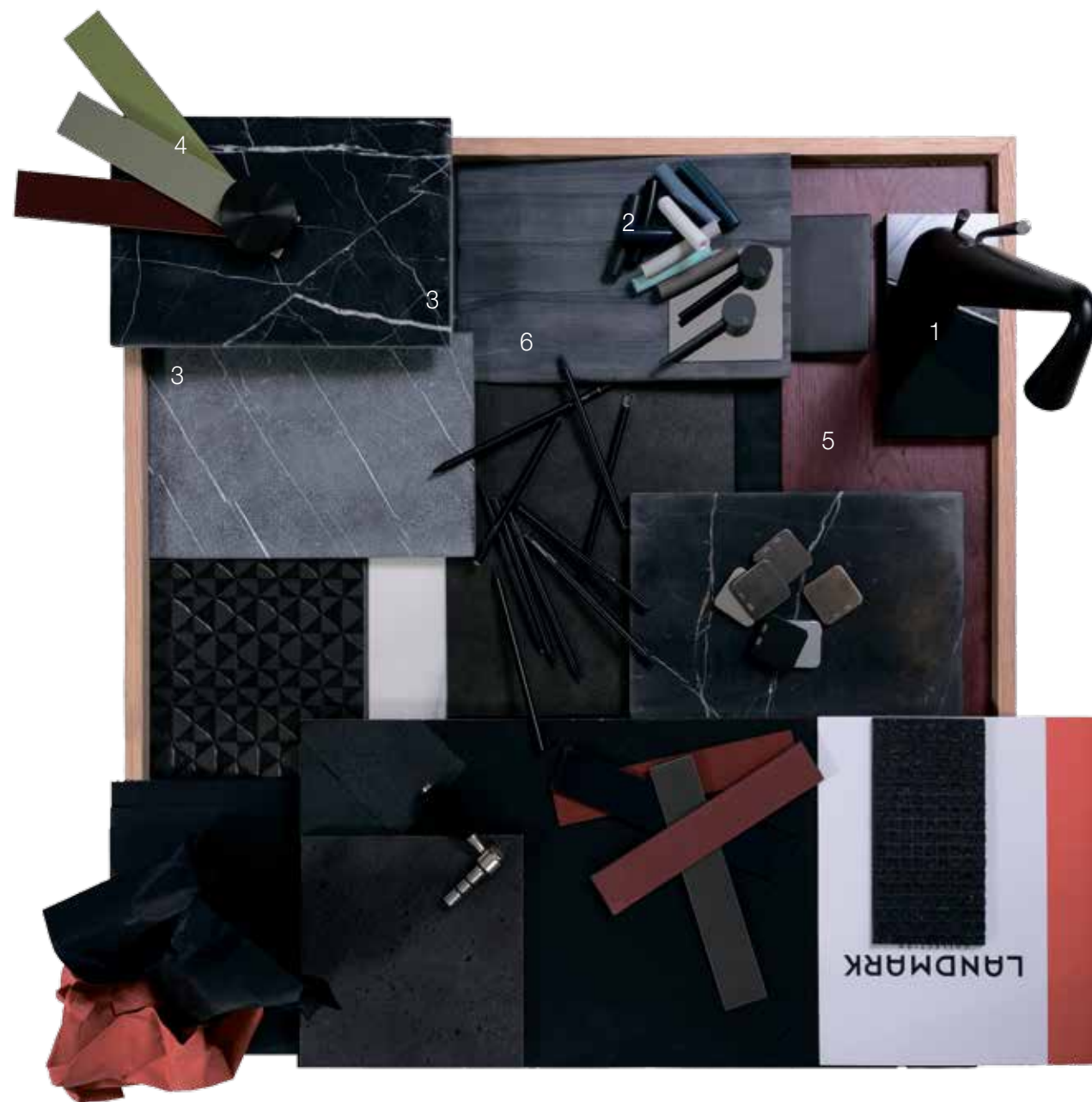
1. ברז בנימור שחור מאט של המותג האיטלקי Gessi 2. ידיית בגווים ובנימוקים שונים של ברז gaston מבית המותג האיטלקי cea 3. אבן טבעית nero marquina בנימור שחור ואפור מאט 4. דוגמאות זכוכית או גיוון לצבע בתנור לחייתות ארוגות בעיצוב אישי של המותג האיטלקי Falper 5. פרקט אלון מטון לפי בחירה מבית המותג הפורטוגלי Castro 6. אבן טבעית blackwood בנימור מאט