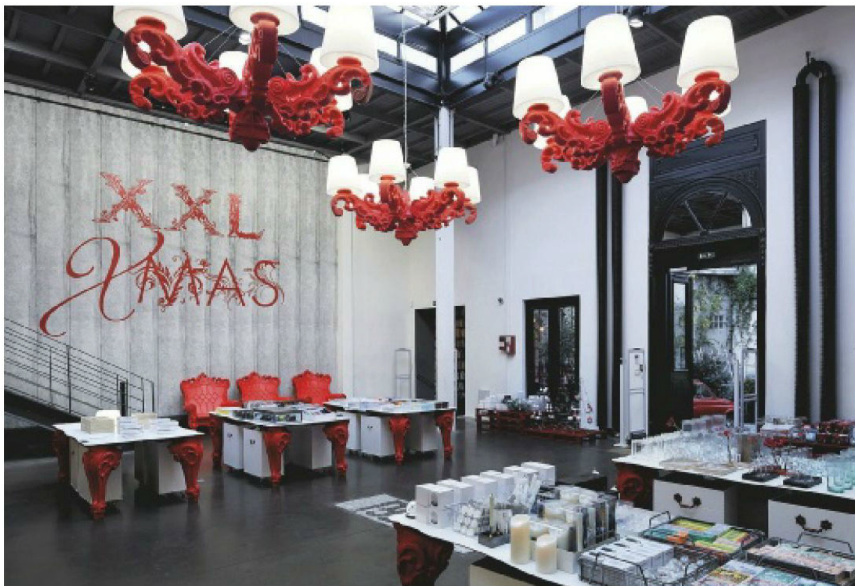
תצוגות מתחלפות מרשימות בחנות MERCI בפריז