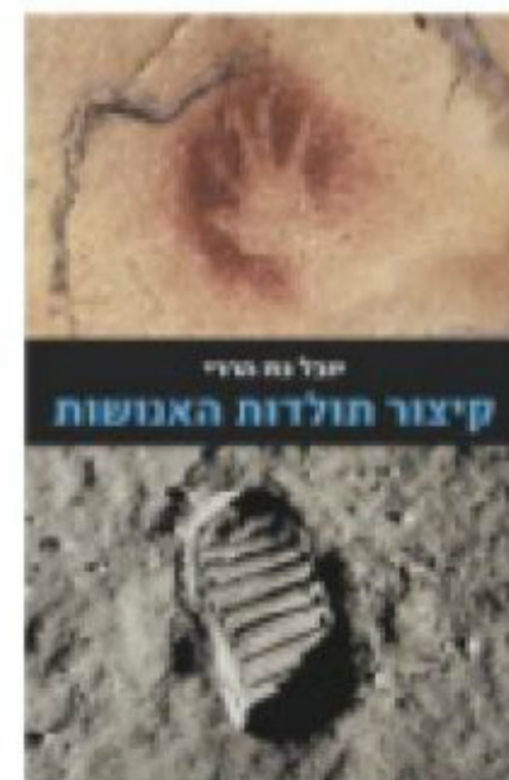
הספר קיצור תולדות האנושות (סריקה)

"קיצור תולדות האנושות" של יובל נח הררי. מדובר בספר הסוקר את ההיסטוריה האנושית מאז הופעתו של האדם על פני הכדור. הררי מאיר נקודות קריטיות בסיפור התפתחותו של המין האנושי באופן שמערער בהתרגשות יסודות ועובדות כמעט ברורות מאלהן. תמונתו של האדם בעולם ותפיסת מקומו כחיית-על מארגנים סדר חדש ושופכים אור על גורלנו בעולם ההווה והעתיד. מדהים לגלות כיצד תהליכים שהתרחשו לפני עשרות אלפי שנים רלוונטיים לנו היום ועד כמה ההישגים האדירים והמקום שתפס האדם בעולם ברורים אחרי קריאת הספר. זה ספר שבו המורכב והפשוט נפגשים לדואט מרתק."