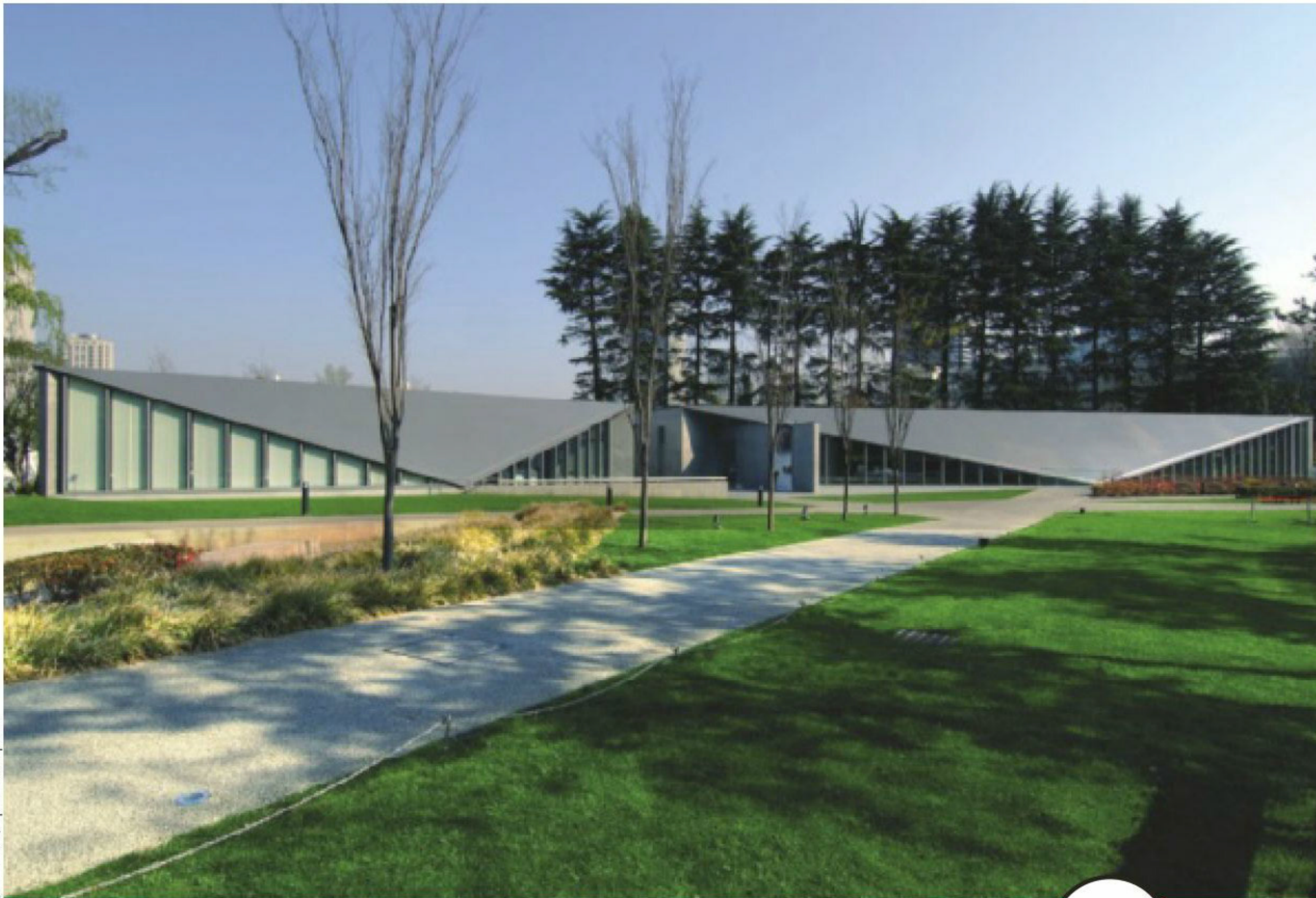
מחזיאון 2021 בטוקיו