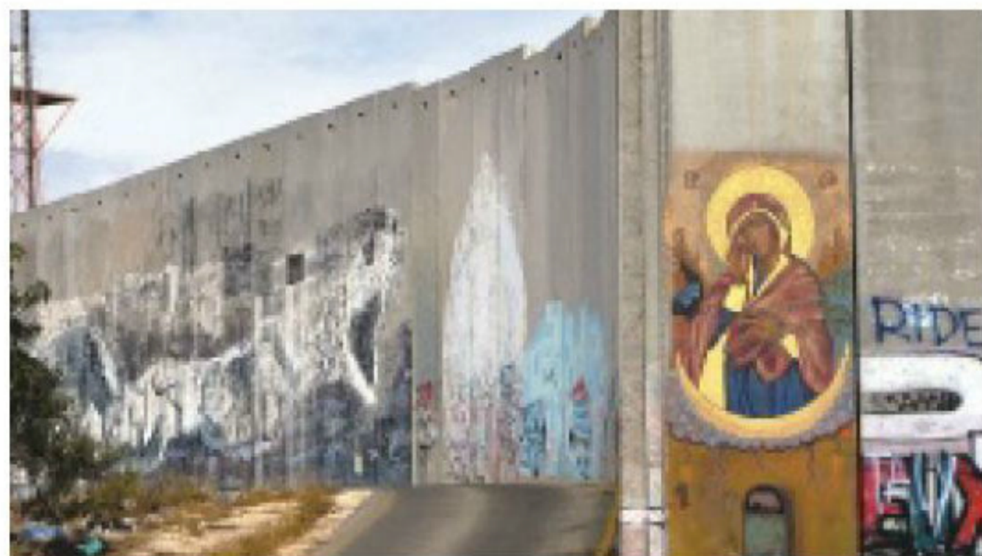
נבירתנו המפילה את החומה, בית לחם 2016, מתוך תערוכת: סטטוס קוו - מבנים של משא ומתן, מוזיאון תל אביב

דווקא בשל המורשת ההומניטרית שלה. מייסדי החנות פתחו אותה כשלנגד עיניהם שתי מטרות חשובות, אשר בעינינו מצדיקות את קיומה לפני הכל: האחת, מתן במה למעצבים צעירים מרחבי העולם; המטרה השנייה קיימת מאז פתיחת החנות ב-2009, כאשר חלק מהכנסותיה מועבר כתרומה לטובת הקמה ופיתוח של מוסדות חינוך באזורים נזקקים.