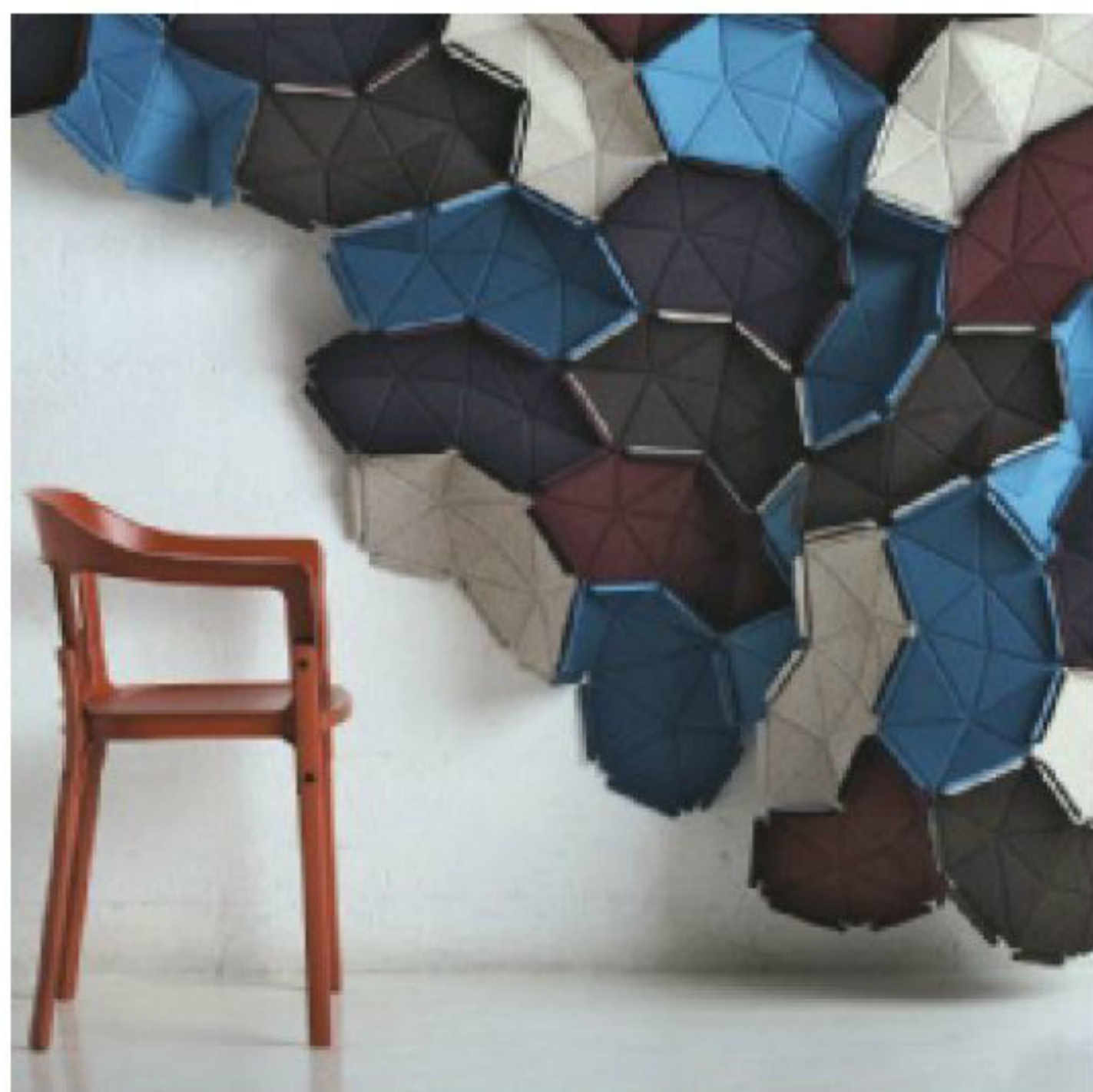
אולם התצוגה של מותג הטקסטיל קבאדרט בקופנהגן, בעיצוב האחים בורולק

התוצרים שלהם משלבים רוח של כיף ודיוק ברמות הכי גבוהות שיש, והפתרונות שלהם גאוניים בפשטותם, לדעתנו. תערוכה של השניים שנערכה במוזיאון תל אביב ב-2015, 'מחיצות', היתה תמצית מדויקת למכלול העצום של עבודותיהם."